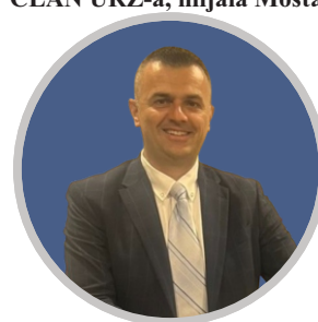
SPECIJALAN GOST PREDAVAČ ČLAN URŽ-a, filijala Mostar: